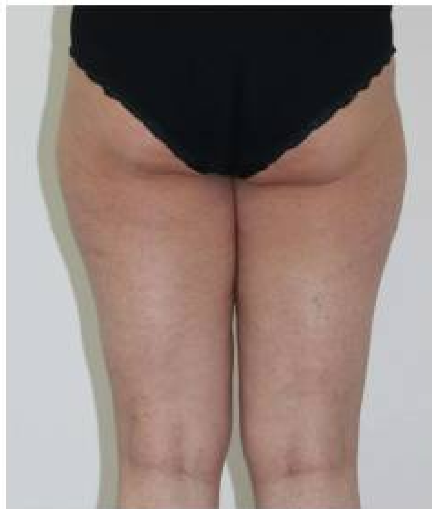
Dopo 6 sedute