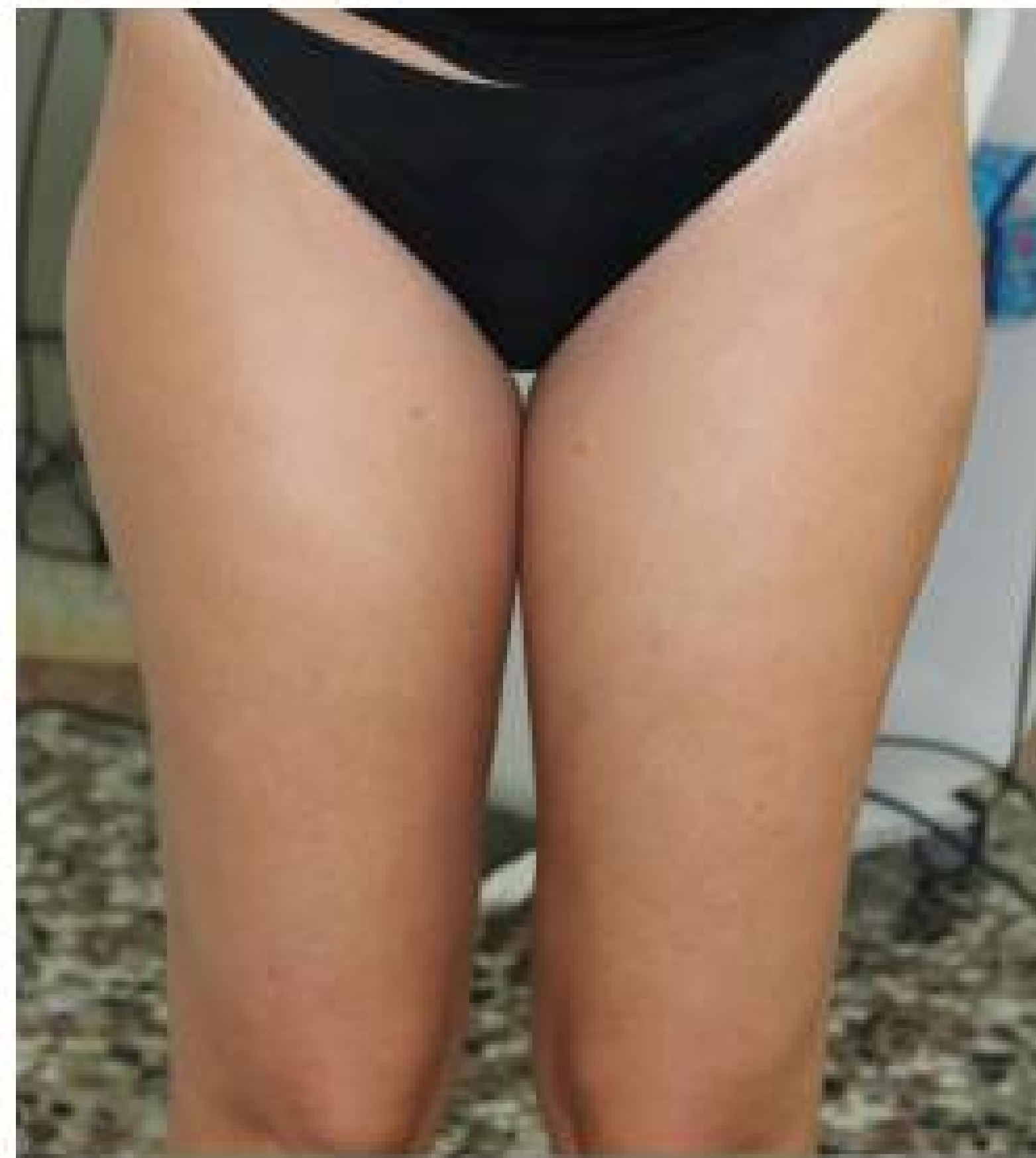
Dopo 6 sedute