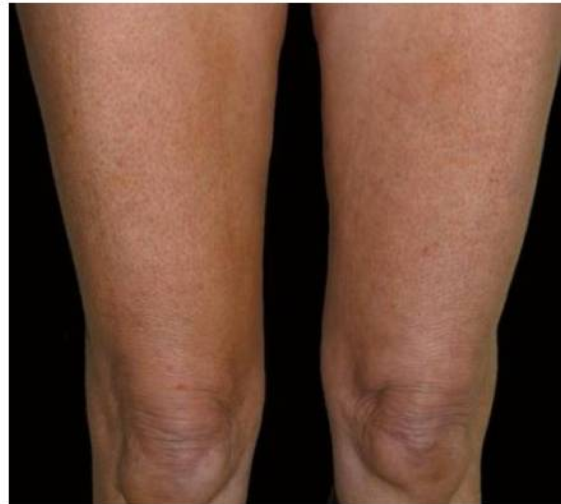
Dopo 6 trattamenti