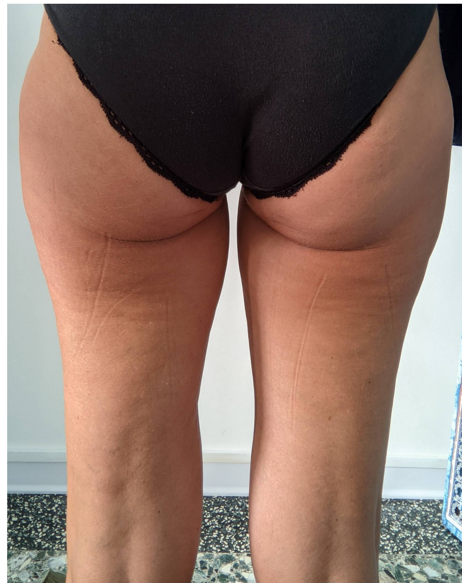
Dopo 6 trattamenti