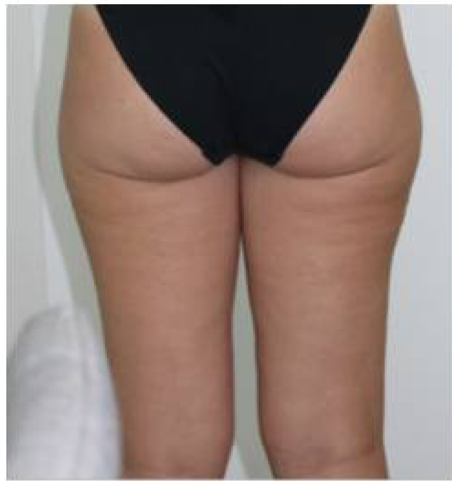
Dopo 6 sedute